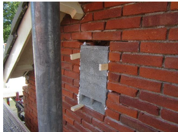
Een van de geplaatste vogel/vleermuiskasten

Zoals bepaald in het ecologisch plan worden er op diverse aangewezen plekken in de wijk vogel/vleermuiskasten opgehangen.